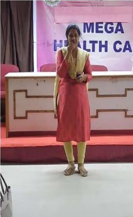
Inauguration of Health camp